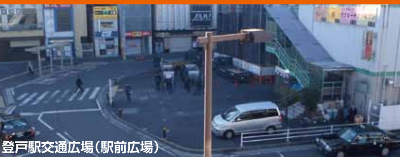
登戸駅交通広場(駅前広場)